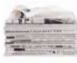
Papiers, Cartons Journaux, Magazines