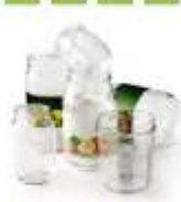
Pots, bocaux et bouteilles en verre